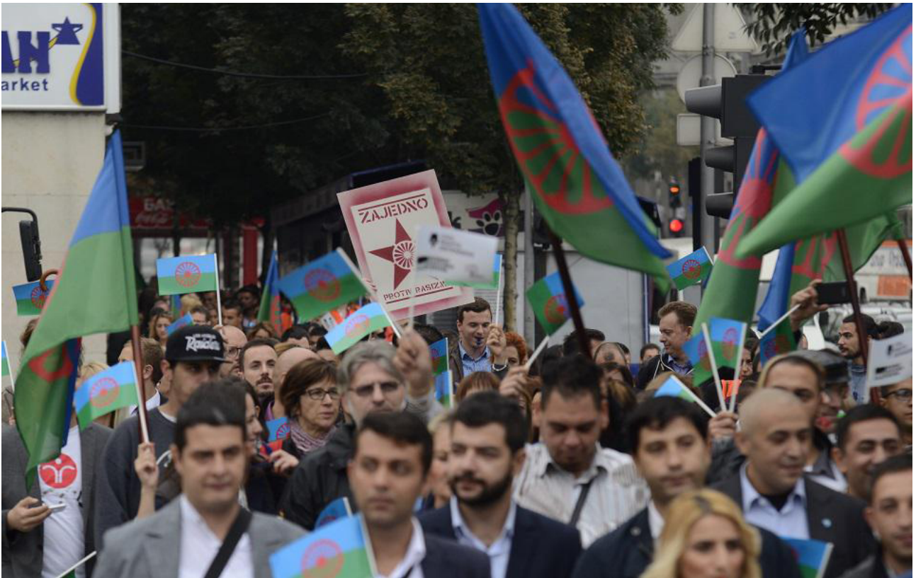
Romski i LGBT+ aktivisti zajedno na Roma prajdu u Beogradu 2015. godine