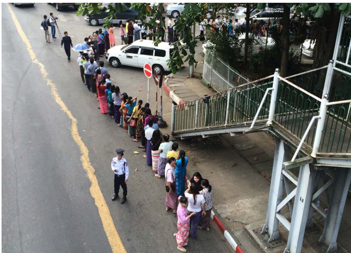
Långa köer av väljare lägger sina röster i Myanmars historiska val den 8 november. Under 2015 intensifierade Civil Rights Defenders arbetet i landet.

Journalister och andra människorättsförsvarare, som Natalia Estemirova i Ryssland, mördades på grund av sitt arbete. Auktoritära ledare och diktatorer lärde sig av och kopierade andra repressiva staters metoder och lagstiftning. Samtidigt såg vi hur vi och andra organisationer var alldeles för beroende av statligt bistånd och därmed av politiska beslut som inte alltid grundade sig på en gemensam uppfattning om saker och tings tillstånd i världen, inte minst i fråga om situationen för mänskliga rättigheter. Kort sagt – vi insåg att vi behövde åstadkomma förändring inte enbart på fältet utan även i strukturen.